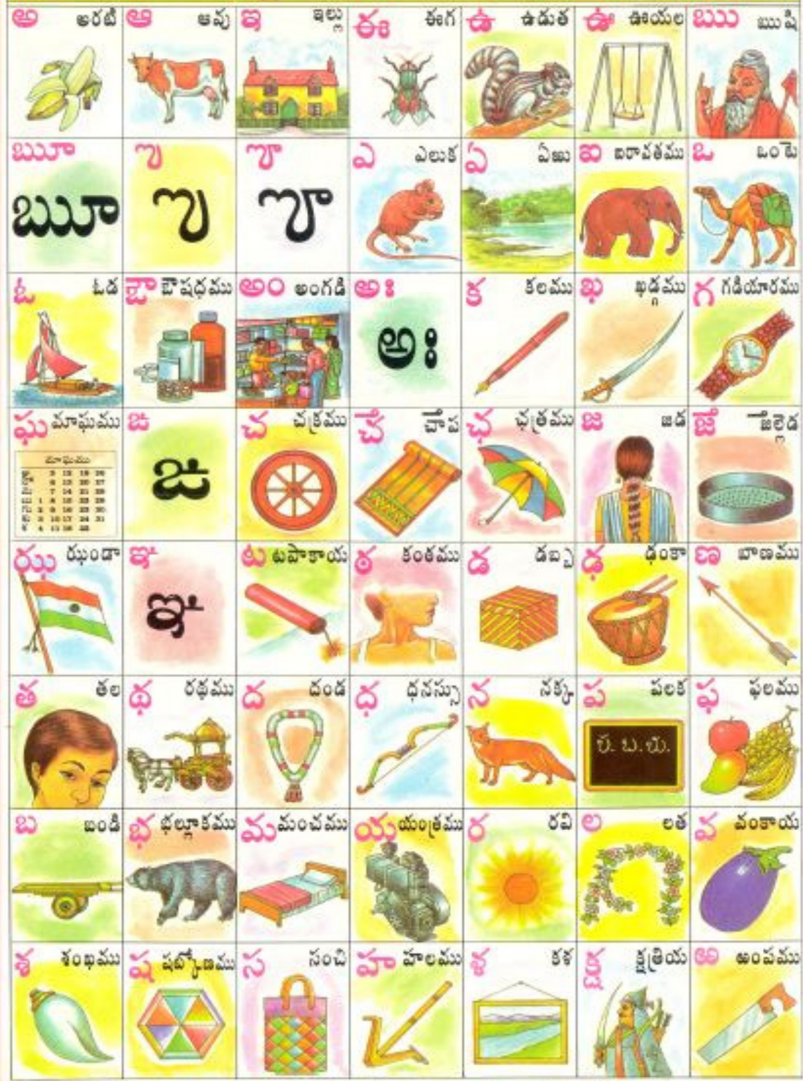
CHART NO. 107